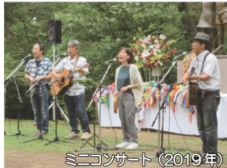
ミニコンサート (2019年)

※雨天の場合は、会場を卯辰山「千寿閣」に変更します。 前日より石川県生協連のホームページで変更の案内を 掲載します。(当日のお問合せ先：090-2370-2408 浅田)